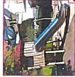
Spielturm mit Röhrenrutsche