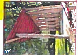
Dreieckpodest mit Pultdach